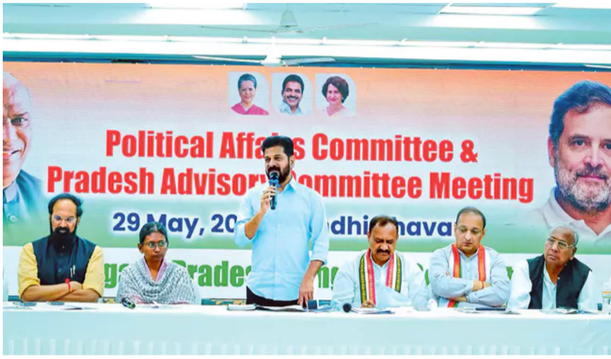
హైదరాబాద్: ఇకపై క్షేత్రస్థాయి కార్యకర్తలను తాను 10 రోజులకోసారి కలుస్తానని.. నెలలో మూడు రోజులు వారి కోసం సమయం కేటాయిస్తానని సీఎం రేవంత్ రెడ్డి చెప్పారు. అందరూ పార్టీ కోసం కష్టపడి పనిచేయాల్సిందేనన్నారు. గాంధీభవన్ లో జరిగిన కాంగ్రెస్ రాష్ట్ర రాజకీయ వ్యవహారాల కమిటీ (పీఏసీ) సమావేశంలో ఆయన మాట్లాడారు. "మంత్రులు.. తాము ఇన్‌ఛార్జిగా ఉన్న జిల్లాకు ప్రతి 10 రోజుల్లో ఒకరోజు వెళ్లి.. పార్టీ కార్యక్రమాల కోసం వూర్తిగా సమయం కేటాయించాలి. మిగతా 2 లో