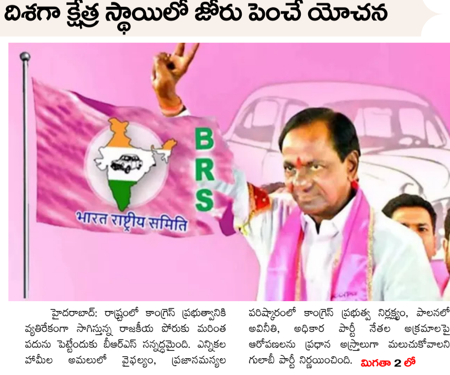
హైదరాబాద్: రాష్ట్రంలో కాంగ్రెస్ ప్రభుత్వానికి వ్యతిరేకంగా సాగుస్తున్న రాజకీయ పోరుకు మరింత పదును పెట్టేందుకు బీఆర్ఎస్ సన్నద్ధమైంది. ఎన్నికల హామీల అమలులో వైఫల్యం, ప్రజాసమస్యల పరిష్కారంలో కాంగ్రెస్ ప్రభుత్వ నిర్లక్ష్యం, పాలనలో అవినీతి, అధికార పార్టీ నేతల అక్రమాలపై ఆరోపణలను ప్రధాన అస్త్రాలుగా మలుచుకోవాలని గులాబీ పార్టీ నిర్ణయించింది. మిగతా 2 లో

మాజీ 'విశ్వగురు' అంటుంటారు కానీ ఒక్క పరీక్షను సరిగ్గా నిర్వహించడం లేదు సీయూఈటీ యూజ్ 2026 పరీక్షలో సాంకేతిక లోపం పలు కేంద్రాల్లో రెండో షిఫ్ట్ పరీక్ష అలసత్వం ప్రారంభం సమస్యను పరిష్కరించామని, అదనపు సమయం ఇస్తామని ఎన్టీపీ ప్రకటన విద్యా వ్యవస్థను నాశనం చేస్తున్నారంటూ కేంద్రంపై రాహుల్ గాంధీ ఆగ్రహం