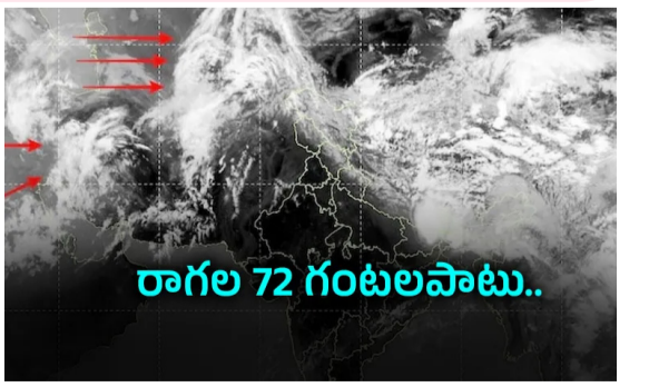
రాగల 72 గంటలపాటు..

ద్రోణి ప్రభావంతో.. అటు ఆంధ్రప్రదేశ్, ఇటు తెలంగాణలోని పలు ప్రాంతాల్లో మోస్తరు వర్షాలు కురిసే అవకాశం బలమైన ఈదురు గాలులు సహా పేడుగులతో కూడిన జల్లులు కురుస్తాయి తెలంగాణ, ఏపీలో పలు జిల్లాల్లో ఇప్పటికే గరిష్ట ఉష్ణోగ్రతలు 45 డిగ్రీలు హైదరాబాద్: తెలుగు రాష్ట్రాల్లో ఎండలు దండెత్తిపోతున్నాయి. అదే సమయంలో ద్రోణి ప్రభావంతో ఆంధ్రప్రదేశ్ వర్షాలు పడుతున్నాయి. ఈ భిన్నవాతావరణంలో ఇరు రాష్ట్రాల ప్రజలు ఉక్కిరి బిక్కిరి అవుతున్నారు. ఆకాల వర్షాలతో రైతులు పంట సమృద్ధి పొందుతారు. ఈ లోపు వాతావరణ శాఖ ఇరు రాష్ట్రాలను విగత..26