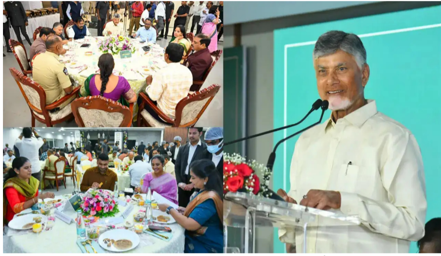
అమరావతి: బిజినెస్ రిఫార్మర్స్ ఆఫ్ ది ఇయర్-2025 అవార్డు రావడానికి టీఎం ఏపీ పని తీరే కారణమని సీఎం చంద్రబాబు నాయుడు అన్నారు. మంత్రులు, అధికారులు, ఉద్యోగులే రియల్ విన్స్ అని సీఎం చెప్పుకొచ్చారు. 'రాజకీయంగానూ...