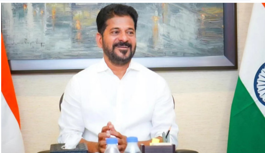
హైదరాబాద్: తెలంగాణ ప్రభుత్వ ఉద్యోగులకు ముఖ్యమంత్రి రేవంత్ రెడ్డి నాలుగు కీలకమైన శుభవార్తలు చెప్పారు. ఉద్యోగ సంఘాల జేపీవీ నేతలతో జరిగిన సమావేశంలో వారి దీర్ఘకాలిక డిమాండ్లపై