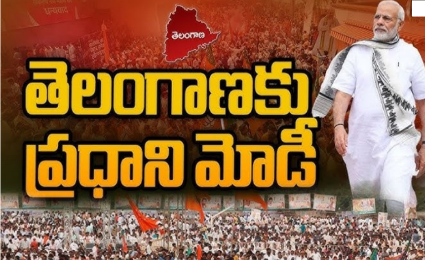
హైదరాబాద్ : మే 10న తేదీన ప్రధాని మోదీ మూడోసారి బాధ్యతలు చేపట్టిన తర్వాత ప్రధాని తెలంగాణలో పర్యటించనున్నారు. కేంద్రంలో తొలిసారిగా తెలంగాణకు మిగతా.. 26