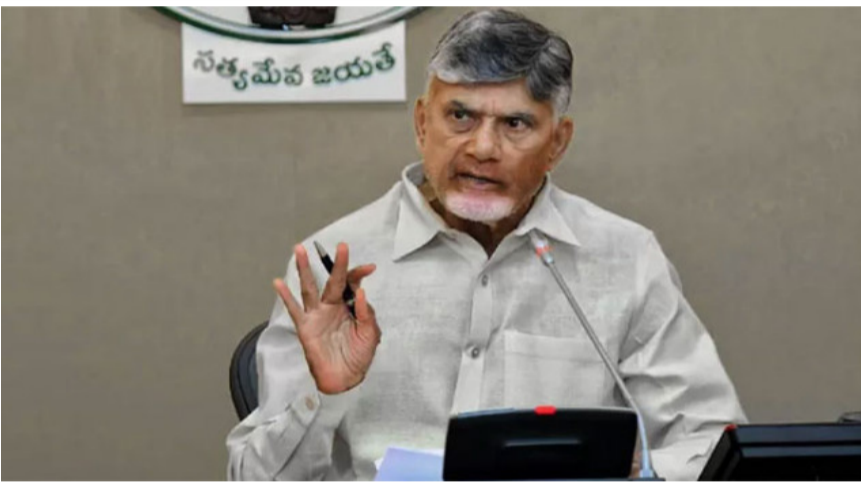
అమరావతి: టీడీపీ అధినేత, సీఎం చంద్రబాబు నాయుడు సొంత పార్టీ నేతలకు, కార్యకర్తలకు తీవ్ర హెచ్చరికలు జారీ చేశారు. అధికారం వచ్చినప్పుడు అహంకారం ఎవరూ ఇగోలకు పోవద్దని, క్రమశిక్షణ తప్పితే సహించేది లేదని ఆయన స్పష్టం చేశారు. టీడీపీ కార్యవర్గ ప్రమాణస్వీకార కార్యక్రమంలో పాల్గొన్న చంద్రబాబు.. పార్టీ నేతలు, కార్యకర్తల ప్రవర్తనపై కీలక సూచనలు చేస్తూనే, మిగతా.. 26