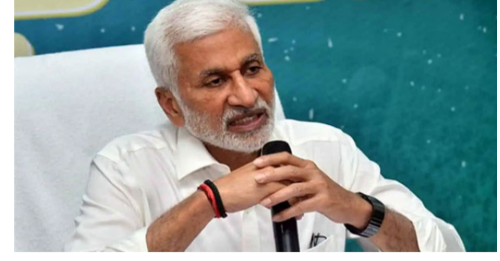
అమరావతి: ఏపీ ప్రభుత్వం కేంద్రకు చేస్తున్న ప్రయత్నాలపై మాజీ రాష్ట్రానికి పెట్టుబడులను ఆకర్షించే ఏపీ విజయసాయిరెడ్డి మిగతా.. 26

విశాఖలో గూగుల్ పై సాయిరెడ్డి కీలక వ్యాఖ్యలు.. ఎకరా 99 పైసలకు ఓకే.. కానీ! విశాఖలో గూగుల్ డేటా సెంటర్ ఏర్పాటును స్వాగతించిన విజయసాయిరెడ్డి ఉద్యోగాల కల్పనపై స్పష్టమైన రోడ్ మ్యాప్ ప్రకటించాలని ప్రభుత్వానికి సూచన 99 పైసలకే భూములు ఇచ్చినా, భారీగా ఉపాధి కల్పిస్తేనే ప్రయోజనం అని వ్యాఖ్య