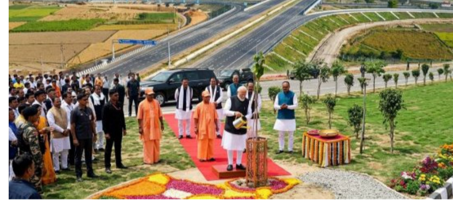
దీర్ఘ: ఉత్తరప్రదేశ్ అభివృద్ధికి కొత్త జీవనాడిలా మారే గంగా ఎక్స్ ప్రెస్ వేను ప్రధాని నరేంద్ర మోదీ బుధవారం ప్రారంభించారు. హలోమోలో జరిగిన ఒక బహిరంగ సభలో, సుమారు రూ. 36,230 కోట్ల వ్యయంతో నిర్మించిన ఈ ప్రతిష్ఠాత్మక ప్రాజెక్టును ఆయన జాతికి అంకితం చేశారు. గంగా మాత పవనర ప్రాంతాల గుండా వెళ్లే ఈ ప్రాజెక్టు ఉత్తరప్రదేశ్ మిగతా.. 26

రూ. 36,230 కోట్లతో గంగా ఎక్స్ ప్రెస్ వే..