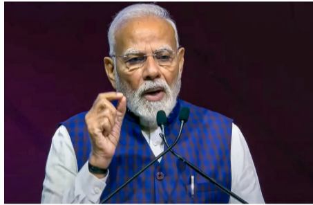
కోల్ కతా: పశ్చిమబెంగాల్ రెండో దశ ఎన్నికల ప్రచారసభల్లో మమతా బెనర్జీ సారథ్యంలోని తృణమూల్ కాంగ్రెస్ పాలనపై ప్రధాని మోదీ విమర్శలు