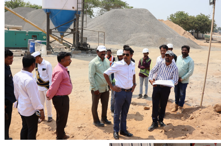
అందుకుగానూ సంబంధిత శాఖల అధికారులు, కాంట్రాక్టర్ల సమన్వయంతో పని చేయాలని సైబరాద్ డివిజన్ ఆఫీసర్లు అనుదీప్ దురిశెట్టి అన్నారు. సురవారం పాల్వే నియోజకవర్గం పరిధిలో జిల్లా కలెక్టర్ పర్యటించారు. ముందుగా ప్రభుత్వం ప్రతిష్టాత్మకంగా చేపట్టిన ప్రజాపాలన ప్రగతి ప్రణాళికలో భాగంగా మండల స్థాయి సమన్వయంతో పాల్వే నగరంలోని పాల్వే మండల కేంద్రంలో 5 ఎకరాల విస్తీర్ణంలో 45 కోట్లతో నూతనంగా నిర్మిస్తున్న 100 పడకల ఏరియా ఆసుపత్రి నిర్మాణ పనులను జిల్లా కలెక్టర్ ఆకస్మికంగా తనిఖీ చేశారు. ఏదులాపురం మున్సిపాలిటీ పరిధిలో 108 కోట్ల అంచనా వ్యయంతో చేపట్టిన జేపిఎస్ యూ ఇంజనీరింగ్ కళాశాల నిర్మాణ పనులను క్రీతస్థాయిలో పరిశీలించారు. బామ్మి, గద్దుల హస్తల్ భవనాలు, ప్రవాస భవన నిర్మాణాల పనుల నాణ్యతను కలెక్టర్ పరిశీలించారు. పనులను నిర్ణీత సమయంలో పూర్తి చేయాలని అధికారులను కలెక్టర్ అభినందించారు. ఈ సందర్భంగా జిల్లా కలెక్టర్ అనుదీప్ దురిశెట్టి మాట్లాడుతూ ప్రభుత్వం విద్య, వైద్య రంగాల అభివృద్ధిని ఆత్మక ప్రాధాన్యంగా తీసుకుని ముందుకు సాగుతున్నది తెలిపారు. గ్రామీణ ప్రాంత ప్రజలకు నాణ్యమైన ఉన్నత విద్య, మెరుగైన వైద్య సేవలు అందుబాటులోకి తీసుకురావడమే ప్రభుత్వం ముఖ్య లక్ష్యమని అన్నారు. జేపిఎస్ యూ