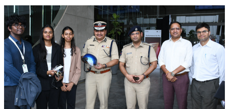
హెల్మెట్లలో అధిక ఉష్ణోగ్రత (హీట్) ఉత్పత్తి అయితే సెన్సార్ ఆక్టివేట్ అయ్యి హెల్మెట్ చల్లబడే విధంగా పనిచేయడం తెలిపారు. అలాగే రోడ్డు ప్రమాదం జరిగినప్పుడు స్టానిక్ పోలీసులకు సమాచారం చేరే విధంగా ఇది పనిచేస్తుంది, ప్రమాదం జరిగిన సమయంలో వాహనం వేగం ఎంత ఉందో కూడా నమోదు అవుతుంది చెప్పారు. మహిళలు ఒంటరిగా ప్రయాణిస్తున్నప్పుడు అత్యవసర పరిస్థితుల్లో స్పందించేందుకు