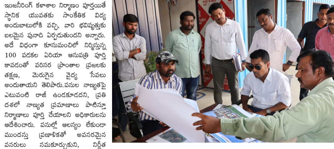
ఇంజనీరింగ్ కళాశాల నిర్మాణం పూర్తయితే స్థానిక యువతకు సాంకేతిక విద్య అందుబాటులోకి వచ్చి, వారి భవిష్యత్తుకు బలమైన పునాది ఏర్పడుతుందని అన్నారు. అదే విధంగా కూసుమంచిలో నిర్మిస్తున్న 100 పడకల ఏరియా ఆసుపత్రి పూర్తి కావడంతో పరిశ్రమ ప్రాంతాల ప్రజలకు తక్షణ, మెరుగైన వైద్య సేవలు అందుతాయని తెలిపారు. పనుల నాణ్యతపై ఎటువంటి లాజ్ ఉండకూడదని, ప్రతి దశలో నాణ్యత ప్రమాణాలు పాటిస్తూ నిర్మాణాలు పూర్తి చేయాలని అధికారులను అభినందించారు. మనల్లో అందరూ ముందస్తు ప్రణాళికతో అవసరమైన పనులను సమకాలీనంగా నిర్ణీత గడువులోనే పూర్తి చేయాలని సూచించారు. అలాగే ప్రజలకు ఉపయోగపడే ఈ అభివృద్ధి పనులు త్వరగా పూర్తి అయితే ప్రభుత్వంపై ప్రజల విశ్వాసం మరింత పెరుగుతుందని,