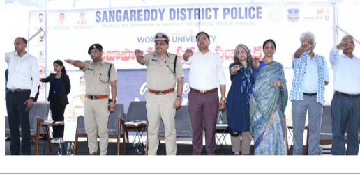
సంగారెడ్డి డిస్ట్రిక్ పోలీస్