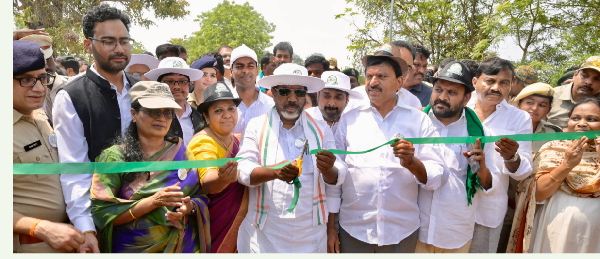
చెల్ల నుంచే వస్తాయని తెలిపారు. అటవీ సంరక్షణకు ప్రభుత్వం, మంత్రిలు ప్రతిష్టాత్మకంగా కృషి చేస్తున్నారని తెలిపారు. కనకగిరి హిల్స్ ఎకో టూరిజం క్రింద నిధులు, నీలగిరి హిల్స్ దేవాలయ పర్మాటక అభివృద్ధి క్రింద నిధులను డిప్యూటీ సీఎం, మంత్రి పొంగులేటి శ్రీనివాస రెడ్డి మంజూరు చేయడం జరిగిందన్నారు. మన చుట్టూ ఉన్న అందమైన ప్రకృతిని కాపాడేందుకు అధికారులు ఎంతో శ్రమిస్తున్నారని తెలిపారు. పులిగుండాలు ఎకో టూరిజం ప్రాజెక్ట్ ద్వారా స్థానికులకు ఉపాధి అవకాశాలు లభించడమే కాకుండా, మన సంస్కృతి, వారసత్వాన్ని ప్రపంచానికి పరిచయం చేసే అవకాశం కలుగుతుందని అన్నారు. ఈ కార్యక్రమంలో రాష్ట్ర గిడ్డంగుల