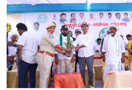
ప్రకటించారు. కనకగిరి హిల్స్ అభివృద్ధికి తక్షణమే కార్యాచరణ ప్రారంభించాలని అధికారులను ఆదేశించారు.

ఖమ్మం, పెనుబల్లి, నేటి శుభోదయ ... పెనుబల్లి మండలం బ్రాహ్మణకుంట పరిధిలోని పులిగుండాలు ఎకో టూరిజం ప్రాజెక్టును బద్దవారి తెలంగాణ రెవెన్యూ, గృహ నిర్మాణ, సమాచార శాఖల మంత్రి పొంగులేటి శ్రీనివాస రెడ్డి, ఉప ముఖ్యమంత్రి మల్లు భట్టి విక్రమార్కతో కలిసి ప్రారంభించారు. అలాగే వారు జంగిల్ సఫారీ, బోడింగ్లను ప్రారంభించి ప్రకృతి ఒడిలో కానీపు విహారించారు.