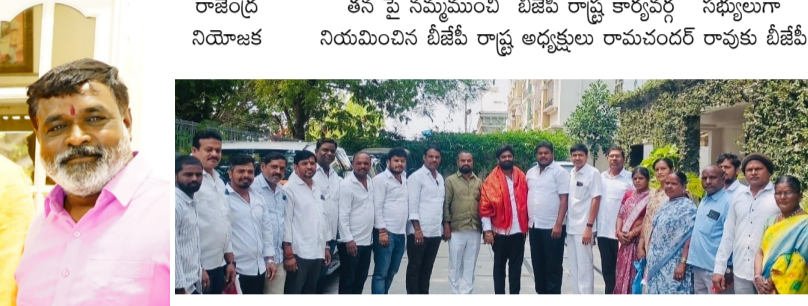
మల్లు నాయకులు, డివిజన్ అధ్యక్షులు విచ్చేసి కాలవ పూల మాలతో సత్కరించిన ఘనంగా వ్యూహాధికార శుభాకాంక్షలు తెలిపారు. ఈ సందర్భంగా ఆయన మాట్లాడుతూ.. రాష్ట్ర బిజెపి పార్టీ