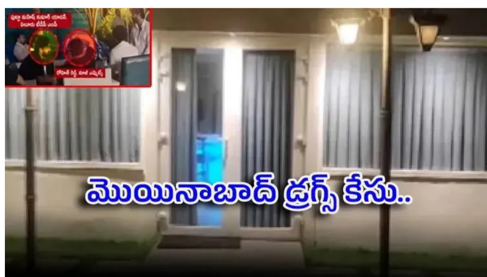
మొయినాబాద్ డ్రగ్స్ కేసు..