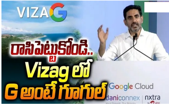
విశాఖ స్టీల్ సిటీ నుంచి గ్లోబల్ ఐఐ హబ్ గా మారింది: మంత్రి లోకేశ్ పెట్టుబడులతో ఏపీ కొత్త చరిత్ర సృష్టిస్తోంది: మంత్రి లోకేశ్ విశాఖపట్నంలో గూగుల్ క్లౌడ్ ఇండియా ఐఐ హబ్ కు శంకుస్థాపన ఒకే రాజధాని, అభివృద్ధి వికేంద్రీకరణే తమ ప్రభుత్వ విధానమని స్పష్టీకరణ మిగతా 2లో

విశాఖ స్టీల్ సిటీ నుంచి గ్లోబల్ ఐఐ హబ్ గా మారింది: మంత్రి లోకేశ్ పెట్టుబడులతో ఏపీ కొత్త చరిత్ర సృష్టిస్తోంది: మంత్రి లోకేశ్ విశాఖపట్నంలో గూగుల్ క్లౌడ్ ఇండియా ఐఐ హబ్ కు శంకుస్థాపన ఒకే రాజధాని, అభివృద్ధి వికేంద్రీకరణే తమ ప్రభుత్వ విధానమని స్పష్టీకరణ ఏ శాఖ వల్ల ఉక్కు నగరం నుంచి డేటా సిటీగా మారుతున్నాం చరిత్ర సృష్టిస్తూన్నాం విశాఖ స్టీల్ సిటీ నుంచి గ్లోబల్ ఐఐ హబ్ గా మారింది: మంత్రి లోకేశ్ పెట్టుబడులతో ఏపీ కొత్త చరిత్ర సృష్టిస్తోంది: మంత్రి లోకేశ్ విశాఖపట్నంలో గూగుల్ క్లౌడ్ ఇండియా ఐఐ హబ్ కు శంకుస్థాపన ఒకే రాజధాని, అభివృద్ధి వికేంద్రీకరణే తమ ప్రభుత్వ విధానమని స్పష్టీకరణ మిగతా 2లో