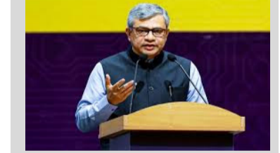
చంద్రబాబు విజన్ కు హోటాస్ ముఖ్యమంత్రి నారా చంద్రబాబు నాయుడు నేతృత్వంలో విశాఖపట్నం త్వరలోనే గ్లోబల్ ఐటీ పట్టణంగా అవతరించబోతోందని కేంద్ర ఐటీ శాఖ మంత్రి అశ్వినీ వైష్ణవ్ ప్రశంసించారు. ముఖ్యమంత్రి నారా చంద్రబాబు నాయుడు నేతృత్వంలో విశాఖపట్నం త్వరలోనే గ్లోబల్ ఐటీ పట్టణంగా మిగతా 2లో