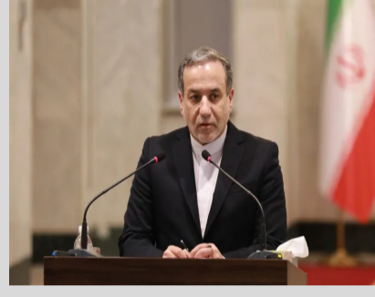
హోరూట్ జలసంధిని దిగ్గంధం నుంచి విముక్తి కల్పించి యుద్ధానికి చరమగీతం పాడితే హోరూట్ జలసంధి గుండా విదేశీ వాణిజ్యనాకల రాకపోకలకు మార్గం సుగమం మిగతా 2లో

హోరూట్ జలసంధిని దిగ్గంధం నుంచి విముక్తి కల్పించి యుద్ధానికి చరమగీతం పాడితే హోరూట్ జలసంధి గుండా విదేశీ వాణిజ్యనాకల రాకపోకలకు మార్గం సుగమం చేస్తామని ఇరాన్ లొత్త ప్రతిపాదనలను తెరవేసింది.