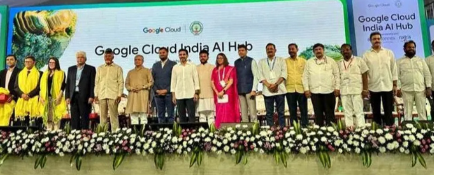
ఆంధ్రప్రదేశ్ చరిత్రలో ఇదొక మరచిపోలేని రోజుని, గూగుల్ సంస్థ రాకతో రాష్ట్ర భవిష్యత్తు పూర్తిగా మారిపోతోందని ముఖ్యమంత్రి నారా చంద్రబాబు నాయుడు ఆకాంక్షించారు. తర్వాత గూగుల్ ఏబి డేటా సెంటర్ నిర్మాణానికి భూమి పూజ చేసిన అనంతరం జరిగిన సభలో ఆయన ఉద్వేగభరితంగా ప్రసంగించారు. ఒకప్పుడు కేవలం సెర్వీ ఇంజనీర్ గా ప్రయాణం మొదలుపెట్టిన మిగతా 2లో

ఏపీకి వచ్చే ప్రతి పరిశ్రమకూ అండగా ఉంటాం భారత గ్రోత్ ఇంజనీర్ గా గూగుల్ అంతర్జాతీయ డేటా గేట్ వేగా విశాఖ బంకుల వద్ద రద్దీ తగ్గాలి.. అవసరమైతే ఆ సిస్టమ్ పెట్టండి