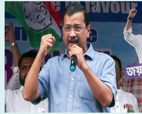
ఢిల్లీ మాజీ ముఖ్యమంత్రి, ఆమ్ ఆద్మీ పార్టీ అధినేత అరవింద్ కేజ్రీవార్, మాజీ ఉపముఖ్యమంత్రి మనీష్ సిసోడియా మంగళవారం రాజ్ఘాట్ ను సందర్శించారు. మహాత్మా గాంధీ స్మారకం వద్ద మిగతా 2లో

ఢిల్లీ మాజీ ముఖ్యమంత్రి, ఆమ్ ఆద్మీ పార్టీ అధినేత అరవింద్ కేజ్రీవార్, మాజీ ఉపముఖ్యమంత్రి మనీష్ సిసోడియా మంగళవారం రాజ్ఘాట్ ను సందర్శించారు. మహాత్మా గాంధీ స్మారకం వద్ద పుష్పాంజలి ఘటించి నివాళు లర్పించారు.