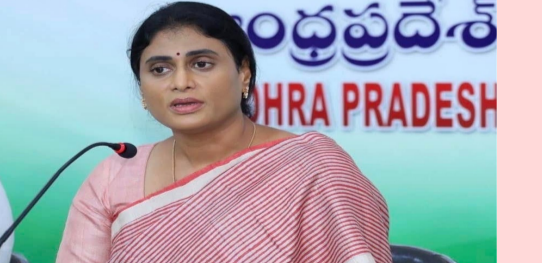
ఇంధన సంక్షోభంపై కూటమి ప్రభుత్వాన్ని నిలదీసిన వైఎస్ షర్మిల రూ.500 డీజిల్ కోసం ఆక్వా రైతు పడిన ఆవేదనను ప్రస్తావించిన వైసం ఇది రైతును రక్షించే ప్రభుత్వమా, భక్షించే ప్రభుత్వమా అని ప్రశ్న రాష్ట్రంలో తీవ్ర ఇంధన సంక్షోభం ఏర్పడిందంటూ ఏపీ కాంగ్రెస్ అధ్యక్షురాలు వైఎస్ షర్మిల కూటమి ప్రభుత్వంపై తీవ్రస్థాయిలో విరుచుకుపడ్డారు. రూ.500 డీజిల్ కోసం మిగతా 2లో