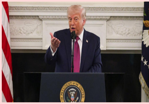
హత్యాయత్నానికి ఒకరకంగా వాళ్లే కారణమని మిగతా 2లో

అమెరికా అధ్యక్షుడు డొనాల్డ్ ట్రంప్ సంచలన వ్యాఖ్యలు చేశారు. దేశానికి డెమోక్రసీ అత్యంత ప్రమాదకరమని.. తనపై జరిగిన అత్యంత ప్రమాదకరమని.. తనపై జరిగిన అత్యంత ప్రమాదకరమని.. తనపై జరిగిన అత్యంత ప్రమాదకరమని..