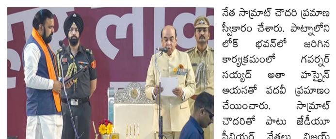
రాష్ట్ర చరిత్రలోనే తొలిసారిగా బిజెపి కుమార్ చౌదరి, విజేంద్ర ప్రసాద్ నేతృత్వంలో ప్రభుత్వం ఏర్పడింది. బీహార్ యాదవ్ కుమార్ ముఖ్యమంత్రిగా బిజెపి సీనియర్ ప్రమాణం చేశారు. విగ... 2లో

బీహార్ లో కొత్త శకం.. తొలి బిజెపి సీఎంగా సామ్రాట్ చౌదరి ప్రమాణం రాష్ట్ర చరిత్రలో తొలిసారిగా బిజెపి నేతృత్వంలో ప్రభుత్వం ఏర్పాటు డిప్యూటీ సీఎంగా విజయ్ కుమార్ చౌదరి, విజేంద్ర ప్రసాద్ యాదవ్ రాజ్యసభకు వెళ్లిన నితీష్ కుమార్.. నాయకత్వ మార్పునకు మార్గం సుగమం బీహార్: బీహార్ రాజకీయాల్లో ఒక చారిత్రక ఘట్టం అవిచ్ఛిన్నమైంది.