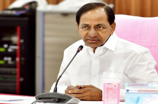
ప్రవేశపెట్టమన్న మహిళా రిజర్వేషన్, నియోజకవర్గాల పునర్వ్యవస్థీకరణ బిల్లులపై మాజీ ముఖ్యమంత్రి, టీఆర్ఎస్ అధినేత కేసీఆర్ స్పందించారు. ఎర్రవెల్లిలోని తన నివాసంలో పార్టీ సీనియర్ నాయకులు కేసీఆర్, హరీష్ రావులతో భేటీ అయ్యారు. ఈ సందర్భంగా దేశ, రాష్ట్ర రాజకీయాలపై వారి మధ్య చర్చ విగ... 2లో