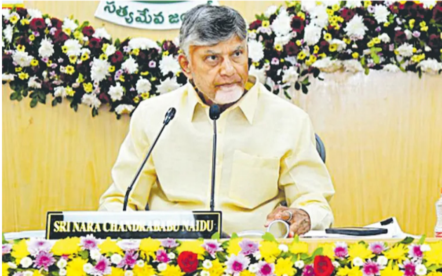
అమరావతి: రాష్ట్రంలో నీటి భద్రతకు పటిష్టమైన చర్యలు చేపట్టాలని, పోలవరం ప్రాజెక్టు పూర్తయ్యాక గోదావరి జలాలను ఎలా వినియోగించుకోవాలిలో స్పష్టమైన 'జలధార' యాక్షన్ ప్లాన్ సిద్ధం చేయాలని ముఖ్యమంత్రి చంద్రబాబు అధికారులను ఆదేశించారు. కుడి, ఎడమ కాలువలకు అనుసంధానంగా ఉన్న విగ... 2లో