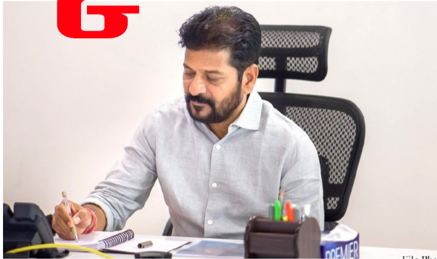
హైదరాబాద్: తెలంగాణ నుంచి కాంగ్రెస్ పార్టీ తరఫున రాజ్యసభకు ఎవరిని పంపాలనే అంశంపై ఉత్కంఠ కొనసాగుతోంది. అభ్యర్థులను ఖరారు చేసేందుకు మిగతా..26