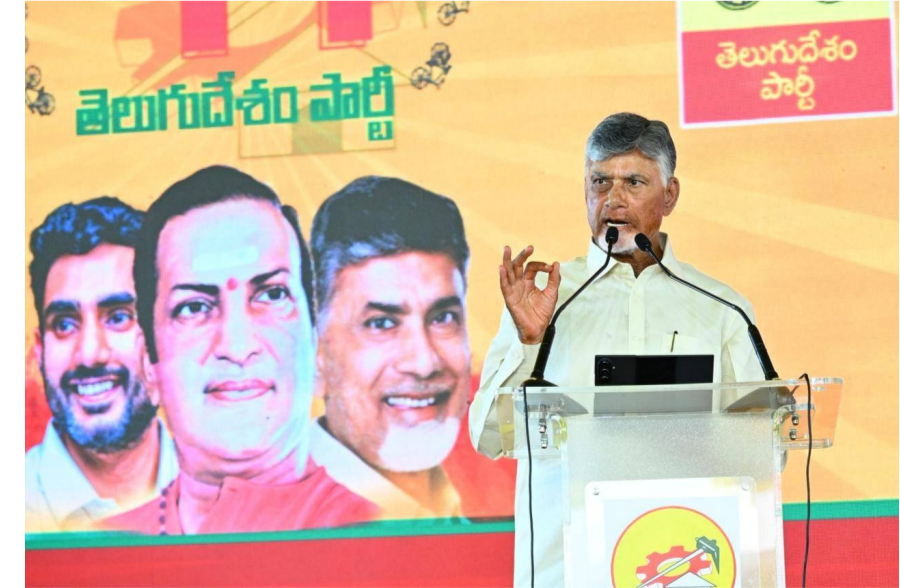
ఆమరావతి: తెలుగుదేశం పార్టీకి కార్యకర్తలే పునాది అని, వారిని నిర్లక్ష్యం చేసే నాయకులను తాను ఉపేక్షించబోనని ముఖ్యమంత్రి చంద్రబాబు స్పష్టం చేశారు. "కార్యకర్తలను దూరంగా ఉంచే నేతలను నేను దూరంగా ఉంచుతా. కార్యకర్తలను ఇబ్బంది పెట్టే నాయకులు మాకు అవసరం లేదు" అంటూ తీవ్ర స్వరంతో హెచ్చరికలు జారీ చేశారు. పార్టీ గుర్తుపై గెలిచి ఎమ్మెల్యేలు, మంత్రులు అయిన ప్రతి ఒక్కరూ ఈ విషయాన్ని గుర్తుంచుకోవాలని ఆయన హితవు పలికారు. టీడీపీ 44వ ఆవిర్భావ దినోత్సవం సందర్భంగా ఆదివారం పార్టీ కేంద్ర కార్యాలయంలో జరిగిన సభలో విగతా.. 26