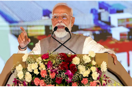
ఢిల్లీ: పశ్చిమాసియాలో నెలకొన్న యుద్ధ వాతావరణంలో చిక్కుకుపోయిన భారతీయ పౌరులను సురక్షితంగా స్వదేశానికి తరలించడంలో సహాయం అందించిన గల్ఫ్ దేశాలకు ప్రధానమంత్రి నరేంద్ర మోదీ ధన్యవాదాలు తెలిపారు. కష్టకాలంలో భారతీయులకు అండగా నిలిచిన యూఏఈ, సౌదీ అరేబియా, ఖతార్, ఒమన్ దేశాల నాయకత్వానికి ఆయన ప్రత్యేక కృతజ్ఞతలు తెలియజేశారు. విగతా.. 26