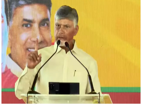
చేయలేకపోయారు ఆధిపత్య, సీఎం చంద్రబాబు అన్నారు. విజయాలే కాదు.. సంక్షోభాలు, సవాళ్లనూ తెదేపా చూసిందని చెప్పారు. ఎన్ని త్యాగాలు చేశారని, ఆస్తులు పోగొట్టుకున్నారని ఆ పార్టీ ఏమీ విగతా.. 26