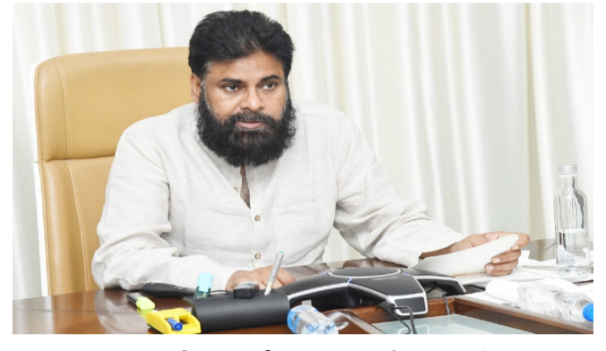
అప్పట్లో సీనియర్లను కాదని.. దళిత నేత భట్టి విక్రమార్కను కాంగ్రెస్ పార్టీ సీఎల్డీ నేతను చేసింది. విగతా.. 26