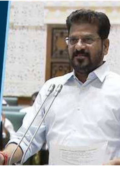
హైదరాబాద్: బీఆర్ఎస్ అధికారంలోకి రాగానే దళితుడిని ముఖ్యమంత్రిని చేస్తానన్న హామీని కేసీఆర్ తుంగలో తొక్కారని సీఎం రేవంత్ రెడ్డి విమర్శించారు.

"రేవంత్ ముందు బీఆర్ఎస్ నేతల బెదిరింపులు నడవవు"