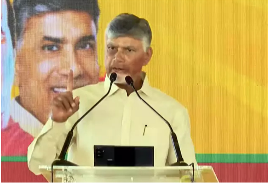
అమరావతి: తెదేపా కోసం ఎంతోమంది కార్యకర్తలు త్యాగాలు చేశారుని, ఆస్తులు పోగొట్టుకున్నారని ఆ పార్టీ అధినేత, సీఎం చంద్రబాబు అన్నారు. విజయాలే కాదు.. సంక్షోభాలు, సవాళ్లనూ తెదేపా చూసిందని చెప్పారు. ఎన్ని కుట్రలు చేసినా పాల్టీని ఎవరూ ఏమీ చేయలేకపోయారు