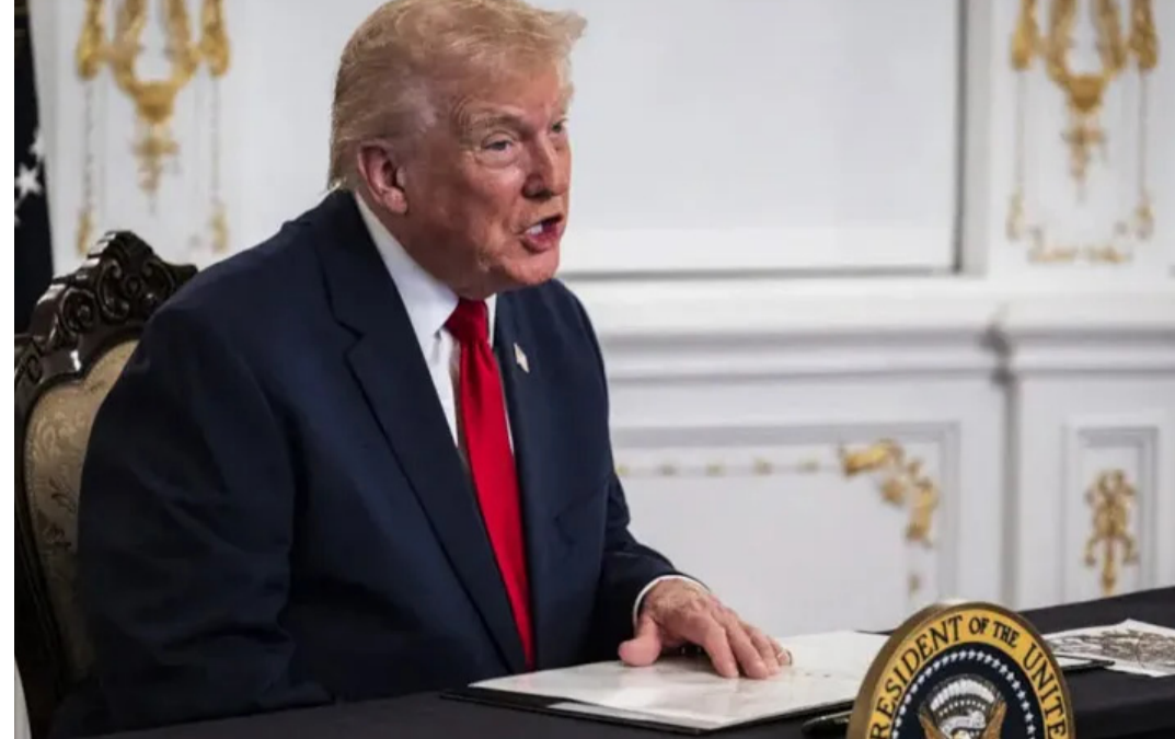
అటంకం ఎదురైంది. ఆయన అధికారంలోకొచ్చిన వెంటనే దాస్తంతటిని ఆపేశారు. అప్పుడే అంటే ఏదో వంకర వెనిజులాను హస్తగతం చేసుకోవాలని అమెరికా ప్రయత్నించింది. చాజెత్ అనారోగ్యంతో మరణించిన 2013లో అధికారంలోకొచ్చిన మదురోను ఇబ్బందిపెట్టిన రోజులూ లేదు. క్రితంసారి ఏలుబడిలో ట్రంప్, వెనిజులా నుంచి పారిపోయినవచ్చిన జావన్ గ్రెడ్ ను దేశాధ్యక్షుడిగా ప్రకటించి భంగపెట్టారు. అక్కడ జరిగిన ఎన్నికలు అప్రజాస్వామికమంటూ విరుచుకుపడ్డారు. ఇప్పుడు ఆ గ్రెడ్ ఏమయ్యాడో తెలియదు. ఈసారి మారక ద్రవ్యాల సాకుతో కత్తిగట్టారు. ట్రంప్ కు మారకద్రవ్యాల అతికట్టే ఉద్దేశం ఉందా? ఉంటే తక్వైన తరలింపు కేసులో నిరుడు అమెరికా కోర్టు 45 ఏళ్ల శిక్ష

విధించిన హెండురన్ మాత్రం అధ్యక్షుడు జావన్ ఓర్కాండోకు ప్రజాభిక్ష పెడతామని గతవారం ట్రంప్ ఎలా చెప్పగలిగారు? వెనిజులాపై సైనిక చర్యకు 70 శాతం మంది అమెరికన్లు వ్యతిరేకమని సీనీఎస్ సర్వే వెల్లడించింది. సైనిక జోక్యం పేరిట జోబ్స్ అమెరికా ఆర్థిక వ్యవస్థ గుల్లయిందని, వాటి జోలికి పోవద్దని మెజిటీ అమెరికన్లు కోరుకుంటున్నారు. నిజానికి అలాంటి హామీతో ట్రంప్ అధికారంలోకొచ్చారు. ఇప్పుడు అందుకు విరుద్ధంగా ప్రవర్తిస్తున్నారు. ఉక్రెయిన్ యుద్ధం నిలుపుదల చేస్తానంటూనే మరో యుద్ధానికి అంకురార్పణ చేస్తున్న ట్రంప్ పోకడ ప్రమాదకరం. అమెరికాకు మాత్రమే కాదు, ప్రపంచానికి ఇది పెను ముప్పు. దీన్ని తక్షణం కట్టిపెట్టాలి.