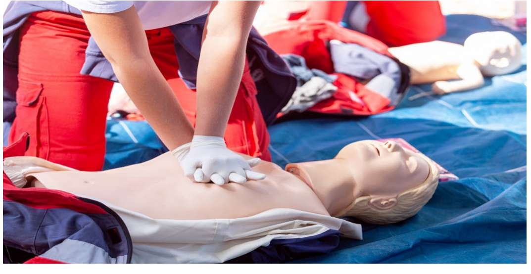
వివరాలను వైద్యులు వెల్లడిస్తున్నారు.

గుండె పోటు వచ్చిన వారికి వెంటనే సీపీఆర్ చేస్తే వారు జీవించే అవకాశాలు గణనీయంగా పెరుగుతాయని డాక్టర్లు సూచిస్తున్నారు. అయితే చాలా మందికి సీపీఆర్ పై అవగాహన లేదు. అనేక మందికి అసలు సీపీఆర్ అంటేనే తెలియదు. ఈ క్రమంలోనే సీపీఆర్ పై ప్రజల్లో అవగాహన పెరగాలని వారు అంటున్నారు. సీపీఆర్ అంటే Cardio Pulmonary Resuscitation (CPR) అని పూర్తి అర్థం వస్తుంది. గుండె పోటు వచ్చిన వారికి సీపీఆర్ చేస్తే గుండె కండరాలకు జిగ్గే నష్టం చాలా వరకు నివారించబడుతుంది. ఈ క్రమంలో వారిని సకాలంలో హార్ట్ లో చేర్చించి చికిత్స అందిస్తే చాలా వరకు నష్టం నుంచి తప్పించుకోవచ్చు. దీని వల్ల గుండెకు వాటిల్లడం జరిగదు. దీర్ఘకాలంలోనూ గుండెకు ఎలాంటి ముప్పు వాటిల్లదు. అలాగే బాధితులు ఎక్కువ కాలం పాటు జీవించి ఉండే అవకాశాలు పెరుగుతాయి. అయితే సీపీఆర్ ఎలా చేయాలనే వివరాలను వైద్యులు వెల్లడిస్తున్నారు.