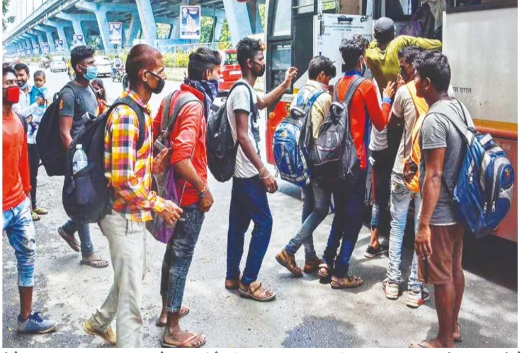
పోలీసులు నిర్బంధించి పలు విధాలుగా వేధించారు. ఏదేళ్ల క్రితం గుజరాత్ లో ఒక పనిపాపై బిహార్ కు చెందిన యువకుడు లైంగిక దాడులకు పాల్పడ్డాడని ఆరోపణ వచ్చినప్పుడు ముకాలు వెలెర్లీ 'బయటి వ్యక్తుల'ని అనుమానం వచ్చినవారిని తీరగా కొట్టి, వారి గుడిసెలకు నివ్వబడించారు. దాంతో బిహార్, ఉత్తరప్రదేశ్, మధ్యప్రదేశ్ రాష్ట్రాలకు చెందిన వేలాదిమంది ప్రాణభయంతో స్వస్థలాలకు తరలిపోయారు. అలస్యంగానూ ప్రభుత్వం జోక్యం చేసుకుని భరోసా ఇచ్చాకే పరిస్థితి చక్కబడింది. ఒడిశాలో రోడ్ల మూలక ఆగడంపై ప్రభుత్వం నిమ్మకు నీరెత్తినట్లు ఉండటమే కాదు... తనవంతుగా వేధింపులకు దిగుతోంది. ఇది సరికాదు.

వలసలు నిజానికి జనాగ్రహం నుంచి పాలకుల్ని కాపాడే రక్షణవచ్చాలి. కనుమ మందిన వారు ప్రభుత్వాలపై ఆగ్రహం వ్యక్తం చేయకుండా, తమ దుర్భరత్వాన్ని నిందించుకుంటూ వేరేచోటకు వలసపోవడంలో అభ్యంతరం ఎందుకుండాలి? దేశభక్తి గురించి లెక్కానిస్తూ పక్క రాష్ట్రం నుంచి వచ్చినవారిని విడదీయాలిగా ముద్రేయటం సిగ్గుచిలువటం లేదా? ఒడిశా నుంచి కూడా లక్షల మంది వలసపోతుంటారు. ఈ చీద విస్తరిస్తే అన్ని రాష్ట్రాల వారికి పరాయి రాష్ట్రాల్లో ఇదే దుస్థితి తలెత్తినా? ఈ పోకడలు సమైక్య భారత్ భావనకు ముప్పు కలిగించనా? ఒడిశా పాలకులు ఆలోచించాలి.