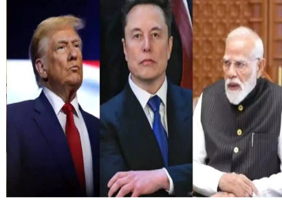
ధీల్లీ: పశ్చిమాసియాలో ఉద్రిక్తతల నేపథ్యంలో, ఇటీవల అమెరికా అధ్యక్షుడు డొనాల్డ్ ట్రంప్ భారత ప్రధాని సరేంద్రమోదీకి ఫోన్ చేసిన విషయం తెలిసింది. ట్రంప్, మోదీ మాట్లాడుకుంటుండగా, పిగతా.. 26

మార్చి 24న మోదీ, ట్రంప్ మాత్రమే ఫోన్ లో మాట్లాడుకున్నట్లు స్పష్టం ఇరాన్, ఇజ్రాయెల్-అమెరికా మధ్య యుద్ధం ప్రారంభమైన అనంతరం మోదీ, ట్రంప్ మధ్య ఈ సంభాషణ మొదలైంది అయితే ఈ చర్చలోకి మూడో వ్యక్తి రాలేదని విడితాంగ మంత్రిత్వ శాఖ స్పష్టం