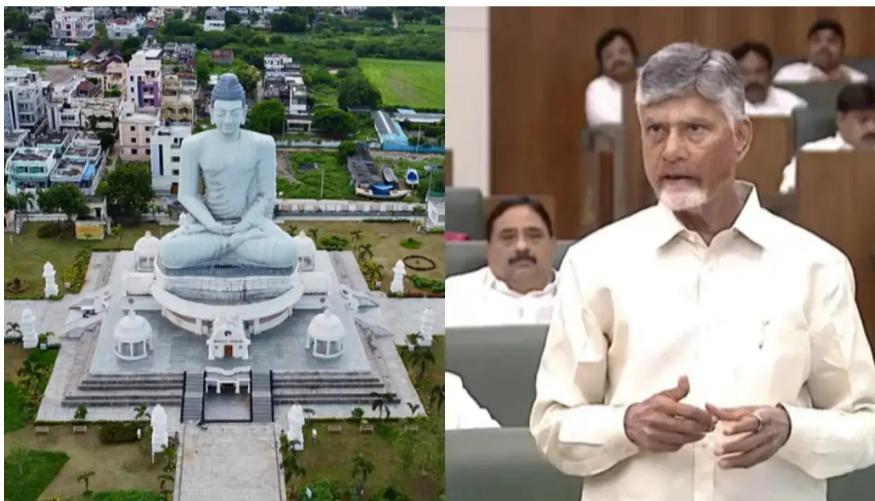
అమరావతి: ఆంధ్రప్రదేశ్ రాజధాని అమరావతి విషయంలో కీలక పరిణామం చోటు చేసుకుంది. ఆంధ్రప్రదేశ్ శాశ్వత రాజధానిగా 'అమరావతి'ని గుర్తించేలా చారిత్రాత్మక తీర్మానాన్ని ముఖ్యమంత్రి చంద్రబాబు నాయుడు అసెంబ్లీలో ప్రవేశపెట్టారు. రాజధాని 'అమరావతి'కి పిగతా.. 26