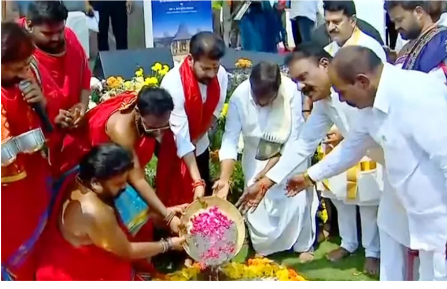
రంగారెడ్డి: మూసీ నది పునరుజ్జీవ ప్రాజెక్టులో మరో ముందడుగు పడింది. మంచినీటి వద్ద భారీ ఎత్తున ఓంకారేశ్వర ఆలయ నిర్మాణం చేపట్టనున్నారు. ఈ వసులకు సీఎం రేవంత్ రెడ్డి చేతుల మీదుగా శంకుస్థాపన కార్యక్రమం జరిగింది. ఆధునిక గోశాల నిర్మాణానికి కూడా సీఎం రేవంత్ శంకుస్థాపన చేశారు. ఆలయ నిర్మాణానికి సంబంధించి మూసీ రివర్ ప్రాంట్ డెవలప్ మెంట్ కార్పొరేషన్ ఇప్పటికే డిజైన్లను ఖరారు చేసింది. ఈ సందర్భంగా సీఎం రేవంత్ కీలక వ్యాఖ్యలు చేశారు. పిగతా.. 26