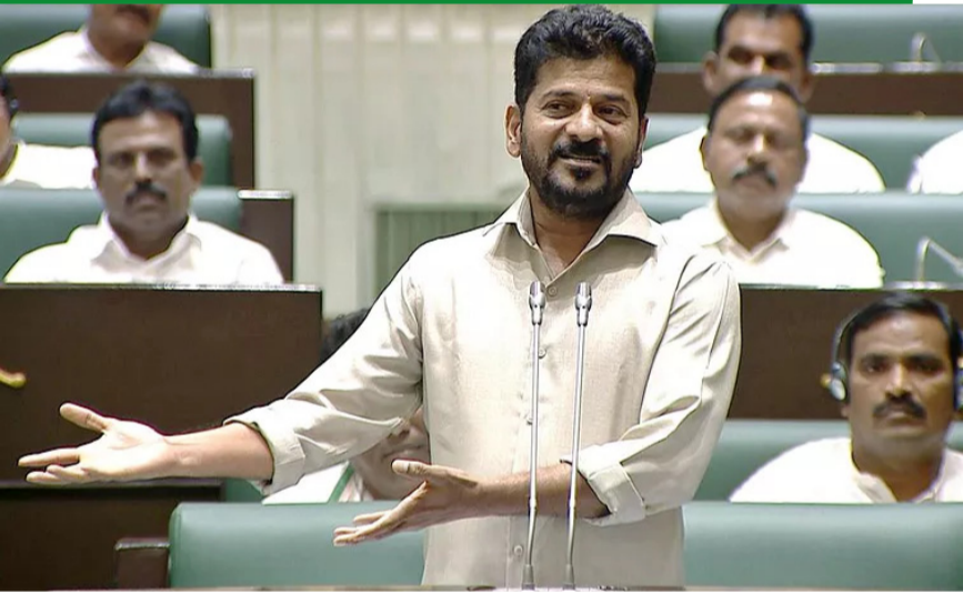
హైదరాబాద్: తెలంగాణలో విద్య, వైద్య రంగాలకు తమ ప్రభుత్వం అత్యధిక ప్రాధాన్యత ఇస్తుందని ముఖ్యమంత్రి రేవంత్ రెడ్డి స్పష్టం చేశారు. ఈ రెండు రంగాలకు కేటాయించిన నిధుల్లో ఒక్క రూపాయి కూడా కోత విధించే ప్రసక్తి లేదని, అవసరమైతే మరన్ని నిధులు కేటాయిస్తామని విగతా..26