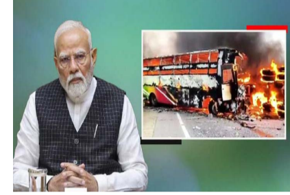
జిల్లాలో ఘోర రోడ్డు ప్రమాదం చోటుచేసుకుంది. పైవేట్ ట్రావెల్స్ బస్సు, టిప్పర్ లాల్ డి క్యాన్సర్ ఫుటనలో భారీ అగ్నిప్రమాదం సంభవించి 12 మంది ప్రయాణికులు సజీవ దహనం అయ్యారు. మరో 22 మందికి విగతా..26