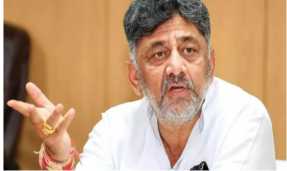
బెంగళూరు : బెంగళూరు ప్రపంచ టెక్ హబ్స్ జాబితాలో నగరాన్ని హైదరాబాద్ తో పోల్చడం, ఈ రెండు నగరాల మధ్య పోలిక సరికాని కర్ణాటక ఉప ముఖ్యమంత్రి డి.కె. శివకుమార్ స్పష్టం చేశారు. కర్ణాటక విగతా..26

జాబ్ లో 6వ స్థానంలో ఉన్న బెంగళూరు 26వ స్థానంలో ఉన్న హైదరాబాద్ తో పోల్చడం తగదు "ఇటీవల విడుదలైన ఒక నివేదిక ప్రకారం, ప్రపంచంలోని టాప్ 10 టెక్ హబ్స్ లో బెంగళూరు ఒకటి దేశంలో బెంగళూరుతో పోల్చదగిన నగరం మరొకటి లేదు