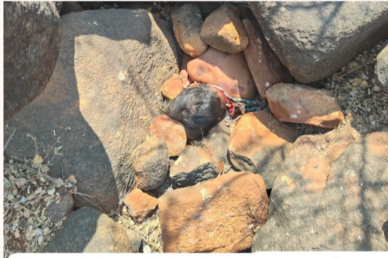
రాళ్లగుట్టవలో బాలుడి మృతదేహం

-అయినవాడి కాలయముడైనా సందర్భం -బావో బావమరిదిని చంపిన వైనం