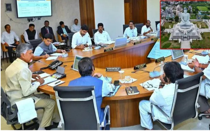
అమరావతి: ముఖ్యమంత్రి చంద్రబాబు అధ్యక్షతన జరిగిన ఏపీ కేబినెట్ సమావేశంలో రాజధాని అమరావతికి సంబంధించి అత్యంత కీలకమైన నిర్ణయం తీసుకున్నారు. అమరావతికి చట్టబద్ధమైన హోదా కల్పించేందుకు ఉద్దేశించిన తీర్మానానికి మంత్రివర్గం ఆమోదం తెలిపింది. డీసీ కోసం ఆంధ్రప్రదేశ్ వనర్విభాగం చట్టం 2014లోని సెక్షన్-5ను సవరించి, కొత్త రాజధానిగా 'అమరావతి' పేరును అధికారికంగా చేర్చాలని ప్రభుత్వం నిర్ణయించింది. విగతా..26