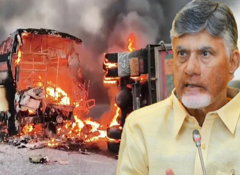
ప్రకాశం జిల్లా : ప్రకాశం జిల్లా మార్కాపురం సమీపంలో జరిగిన ఘోర రోడ్డు ప్రమాదంపై ముఖ్యమంత్రి చంద్రబాబు తీవ్ర దిగ్భ్రాంతి వ్యక్తం చేశారు. గురువారం తెల్లవారుజామున రాయవరం గ్రామ సమీపంలో పైవేట్ ట్రావెల్స్ బస్సు, టిప్పర్ లాల్ డి క్యాన్సర్ ఫుటనలో విగతా..26