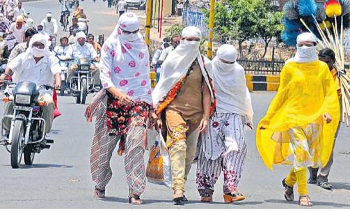
హైదరాబాద్: వేసవి భగభగలు తీవ్రమవుతున్నాయి. ప్రస్తుతం సాధారణ స్థితిలో నమోదు కావాల్సిన ఉష్ణోగ్రతలు ఒకట్రెండు డిగ్రీల సెల్సియస్ మేర అధికంగా నమోదవుతుండగా రానురాను తీవ్రత మరింత ఎక్కువగా ఉంటుందిని వాతావరణ నిపుణులు చెబుతున్నారు. సాధారణంగా మార్చి నుంచి మే మధ్య కాలాన్ని వేసవి సీజన్ గా పరిగణిస్తారు. ఈ ఏడాది వేసవి ఉష్ణోగ్రతలు ఫిబ్రవరి రెండో వారం విగళ..26