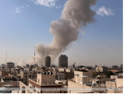
ధీల్లీ: మధ్యప్రాచ్యంలో యుద్ధ మేఘాలు రట్టంగా ఆలముకున్నాయి. ఇరాన్ అణు చర్యలు విఫలమైన నేపథ్యంలో అమెరికా, ఇజ్రాయెల్ ఉమ్మడిగా నిర్వహించిన 'అవరేషన్ ఎపిక్ ఫ్యూజి' దాడుల్లో ఇరాన్ సుప్రీం లీడర్ అయితే అలీ ఖమేనీ మరణించడం తెలిసిందే. టెక్నోసోఫ్ పాటు పలు నగరాలపై జరిగిన ఈ భీకర వైమానిక దాడులకు విగళ..26

అమెరికా, ఇజ్రాయెల్ ఇరాన్ ప్రతీకార దాడులు అమెరికా, ఇజ్రాయెల్ ఉమ్మడి దాడుల్లో ఇరాన్ సుప్రీం లీడర్ ఖమేనీ మరణం ప్రతీకారంగా గంటల వ్యవధిలోనే విరుచుకుపడ్డ ఇరాన్ సైన్యం కువైట్, దుబాయ్ లోని అమెరికా బేసిన్ లక్ష్యంగా క్షిపణి దాడులు దుబాయ్ ఎయిర్పోర్ట్ నహా పలు కీలక ప్రాంతాల్లో పేలుళ్లు యుద్ధం విస్తరించే ప్రమాదంపై ఐక్యరాజ్యసమితి తీవ్ర ఆందోళన