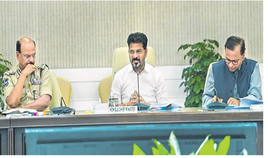
హైదరాబాద్: ప్రజాప్రభుత్వ పథకాలు.. అభివృద్ధి పనులు, ప్రజోపయోగ కార్యక్రమాలను ప్రజలకు మరింత చేరువ చేయాలనే సంకల్పంతో రాష్ట్రంలో మార్చి 6 నుంచి జూన్ 12 వరకు 99 రోజులపాటు 'ప్రజా పాలన ప్రగతి ప్రణాళిక' కార్యక్రమం చేపడుతున్నట్లు విగళ..26