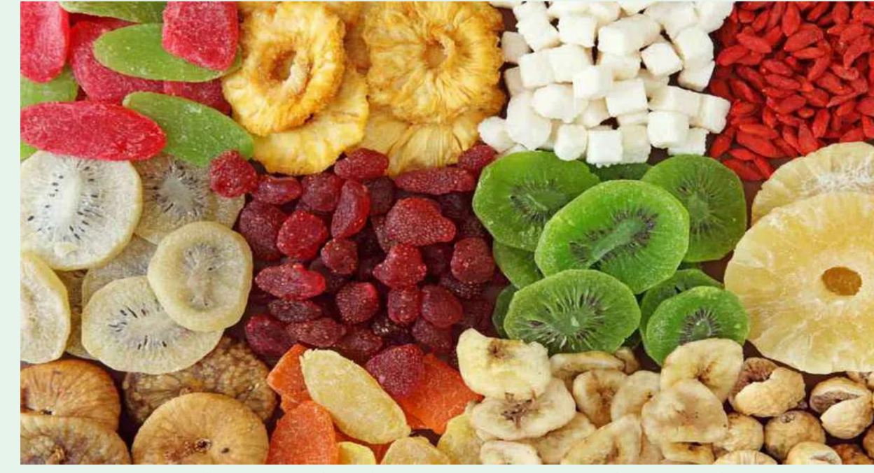
మనల్ని అన్ని విధాలుగా ఆరోగ్యంగా ఉంచడం కోసం అనేక రకాల పోషకాహారాలు అందుబాటులో ఉన్నాయి. వాటిల్లో డ్రై ఫ్రూట్స్ కూడా ఒకటి.

కిస్మిలు, అంజీర్, అలుబుఖర వంటివి డ్రై ఫ్రూట్స్ జాబితాకు చెందుతాయి. అంజీర్, అలుబుఖరతోపాటు యాక్టివ్ క్యూ కూడా మనకు డ్రై ఫ్రూట్స్ రూపంలో అందుబాటులో ఉన్నాయి. ఇవే కాకుండా ఇంకా అనేక డ్రై ఫ్రూట్స్ ను చాలా మంది తింటుంటారు. డ్రై ఫ్రూట్స్ ను తినడం వల్ల అనేక లాభాలు కలుగుతాయి. వీటిల్లో అనేక పోషకాలు ఉంటాయి. ఇవి మనకు ఆరోగ్యకరమైన ప్రయోజనాలను అందిస్తాయి. పలు వ్యాధులను నయం చేయడంలోనూ డ్రై ఫ్రూట్స్ మనకు సహాయం చేస్తాయి. అయితే డ్రై ఫ్రూట్స్ ను రోజులో అసలు ఏ సమయంలో తినాలి..? ఎప్పుడు వీటిని తింటే మనకు అధిక శాతం లాభాలు కలుగుతాయి..? అని చాలా మందికి ప్రశ్నలు తలెత్తుతుంటాయి. ఇక ఇందుకు పోషకాహార నిపుణులు సమాధానాలు చెబుతున్నారు.